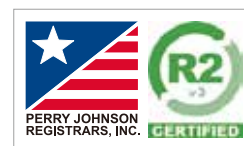
責任あるリサイクル 「R2v3」